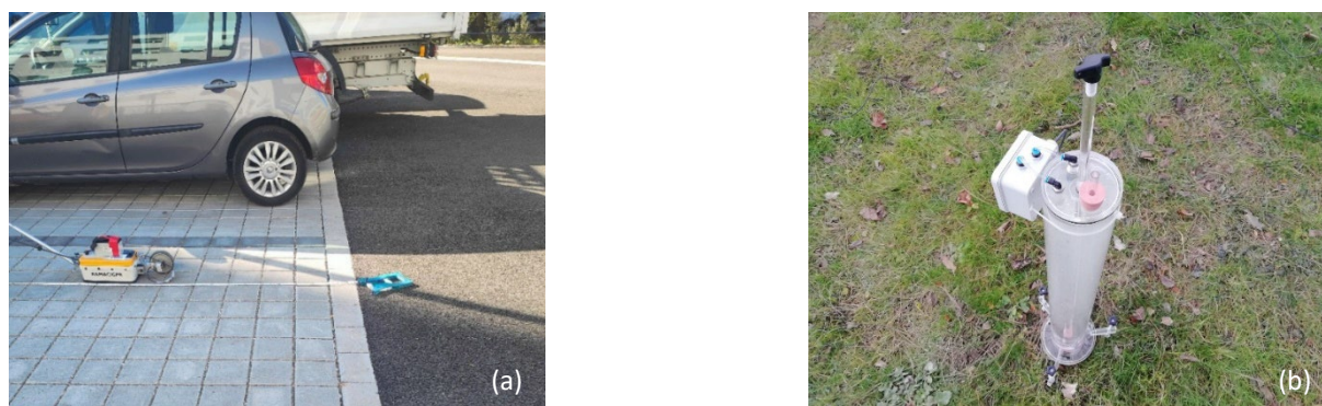
Figure 1 : Transect d'essai au GPR MALÅ 800 MHz sur l'un des parkings d'étude dans le quartier Lizé-Mâcon (a) et infiltromètre automatique développé par Concialdi et al., 2020 (b)

Le choix des fréquences et le paramétrage d'acquisition des radars a reposé sur des essais préliminaires. Les radars MALÅ (500 et 800 MHz) ont été sélectionnés pour un meilleur compromis entre profondeur d'investigation et résolution d'imagerie. Des acquisitions radar en time-lapse (statique) seront réalisées avant, pendant et après les événements pluvieux, ainsi qu'après plusieurs cycles de sécheresse afin de caractériser les chemins préférentiels. Des campagnes vont également être réalisées en infiltration contrôlée par infiltromètre automatique (développé par Concialdi et al., 2020) en simple et double anneau. Le site ainsi que le matériel utilisé sont visibles Figure 1 . Enfin, un effet de compaction pourrait être observé par GPR au cours du suivi.